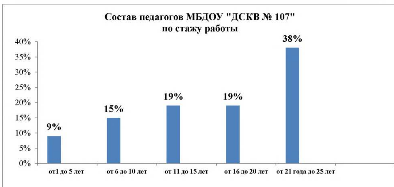
Диаграмма № 3

Из общего числа педагогических работников педагогический стаж от 1 до 5 лет имеют 3 человек (9%), от 6 лет до 10 лет – 5 человек (15%), от 11 лет до 15 лет – 6 человек (19%), от 16 лет до 20 лет – 6 человек (19%), педагогический стаж более 20 лет у 12 человек (38%) (Диаграмма № 3)